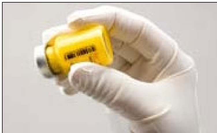
Obrázok C: Dôkladne pretrepte injekčnú liekovku

Ak sa tvorí pena, nechajte injekčnú liekovku postáť, aby sa pena stratila. Ak sa liek nepoužije okamžite, treba ho dôkladne pretrepať, aby opäť vznikla suspenzia.