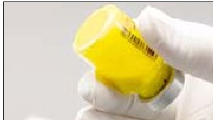
Suspendované: bez zhlukov

Obrázok B: Skontrolujte, či v liekovke neostal nesuspendovaný prášok a ak je to potrebné, opätovne poklepte