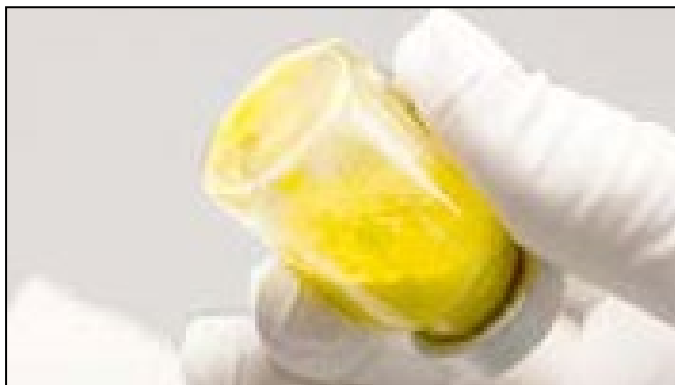
Nesuspendované: viditeľné zhluky