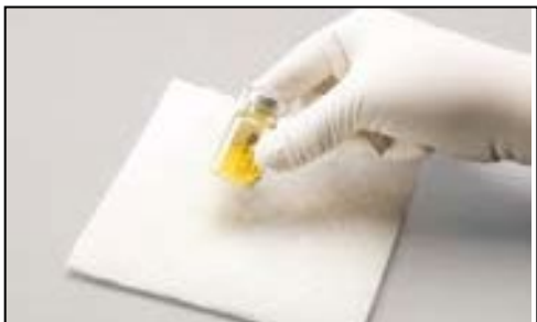
Obrázok A: Dôrazne poklepte, aby sa obsah zmiešal