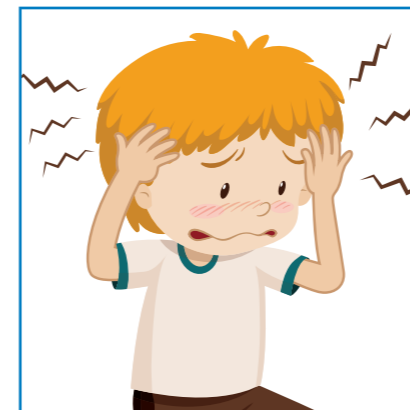
Silná bolesť hlavy