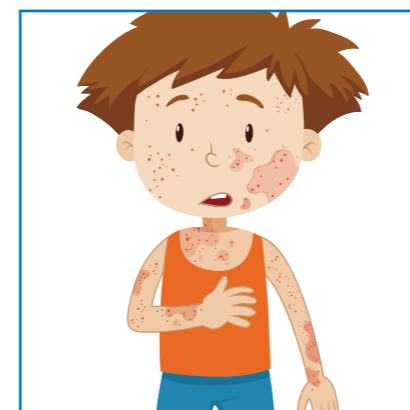
Bledá, sfarbená pokožka, vyrážka