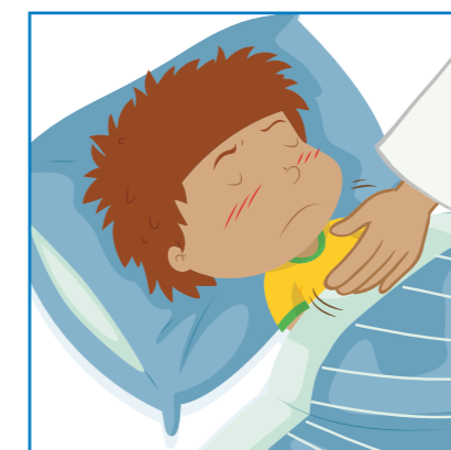
Ospalosť, ťažkosti pri prebúdzaní sa