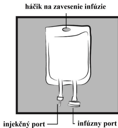
Obrázok 1: Vak